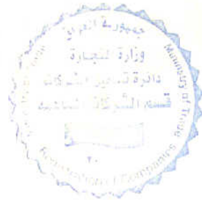
عمار جمعة حسن